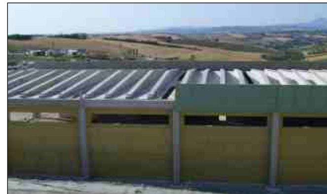
L'impianto consortile per la produzione di compost

Vetro: una volta recuperato e conferito a Cavallari Spa, viene consegnato al Coreve, Consorzio Nazionale Recupero Vetro e in particolare alla ditta Saint Gobain-Vetri Spa (VI)