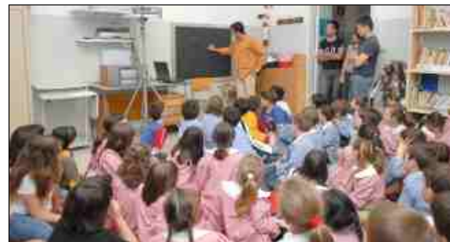
Il CIR33 all'opera nelle scuole