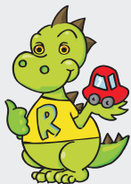
Riuser la mascotte del Centro Ambiente